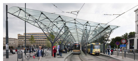
Auvent place Flagey / Bruxelles / D+A International Latz + Partners