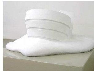
Guggenheim Melting , 2005 - Lehmann Maupin Gallery, New York © Studio Wurm