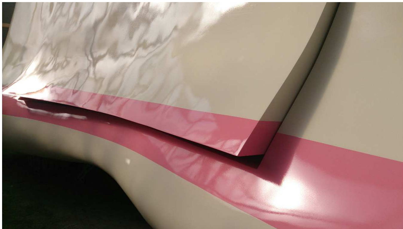
© Erwin Wurm, Bob , préfiguration, 2013

Place François Mitterrand, EURALILLE, LILLE