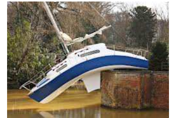
Misconceiveable , 2010 - Xavier Hufkens Gallery, Brussels © Jesse Willems