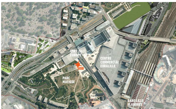
© SPL Euralille, emplacement de Bob , place François Mitterrand, 2013