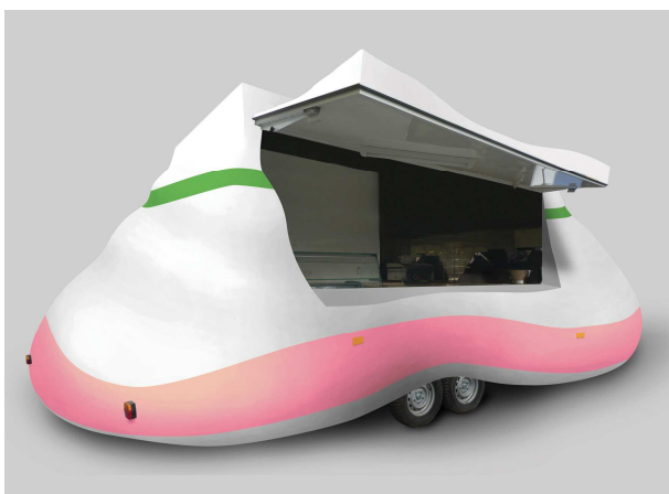
© Erwin Wurm, Bob , visuel de préfiguration, 2013