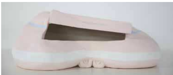
© Erwin Wurm, Bob , maquette, 2013