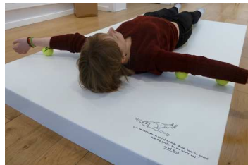
One minute sculpture , 1998