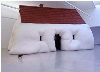
Fat House , 2003 - Baltic Centre for Contemporary Art, Newcastle