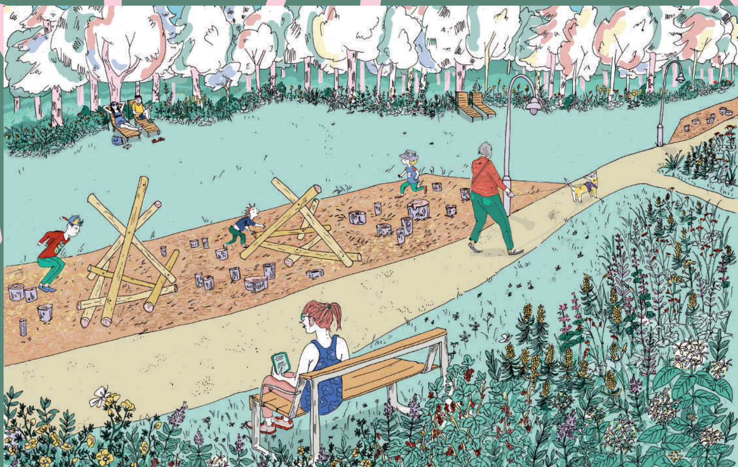
Illustration d'ambiance de la clairière boisée - vue depuis le parking de la Tour Musset Crédits - Lucie Massart