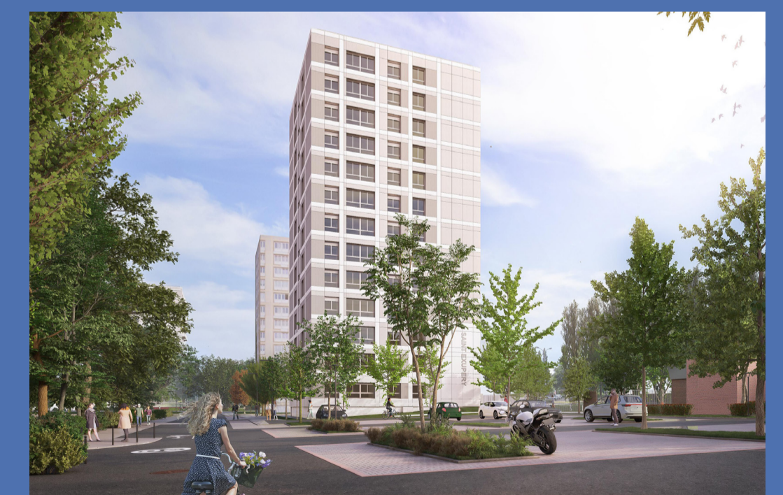
Perspective: réhabilitation de la tour St Exupéry - Partenord Habitat

Tous ces travaux vont être réalisés en présence des habitants. Afin que le chantier se déroule le mieux possible pour les résidents, Partenord va missionner un pilote social. Cette personne aura pour rôle d'accompagner les habitants tout au long du processus des travaux. Il rencontrera chaque locataire à son domicile avant le démarrage des travaux et informera sur la nature et le déroulement du chantier. Il sera l'interlocuteur privilégié : le relais entre les locataires, les entreprises et Partenord Habitat.